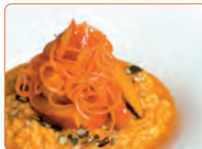
gesund + lecker Vegan leben und essen 16 und 28