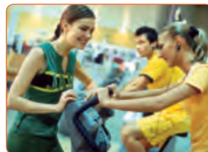
fitnesskurse Winter 2014 11

GoeSF und Badeparadies auch bei Facebook!!! www.facebook.com/goesf oder www.facebook.com/badeparadies